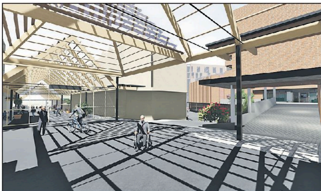
Glasstaket over Storgata kan bygges som en enkel glasskonstruksjon i limtre og glass. (Illustrasjon: KONTUR arkitekter as)

Sivilarkitekt Roar Jacobsen har pusset støvet av en gammel idé om glasstak over Storgata. – Dette er fremtidsrettet utvikling av Gjøviks bykjerne, mener arkitekten.